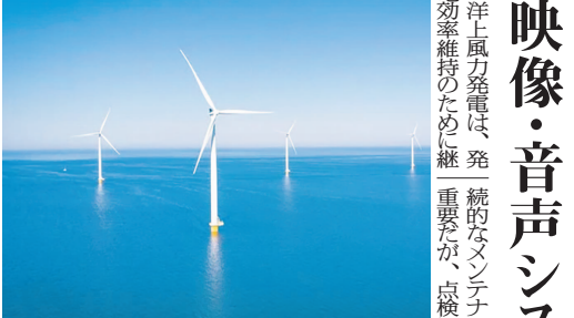
JFEエンジニアと共同で「映像×音声」での遠隔管理を推進

映像・音声システム連携 洋上風力発電は、従来のメンテナンスが困難なため、遠隔管理の重要性が、点検に向かう映像・音声システムが、遠隔管理を実現する。